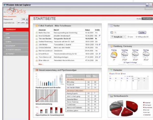
→ Individuelle Startseite des Portals

Der Benutzer muss nicht mehr zwischen verschiedenen Anwendungen wechseln, sondern meldet sich einmalig am Unternehmensportal an (Single Sign-On) und sieht dank eines rollenbasierten Zugriffs seine personalisierte Oberfläche mit genau den Funktionen/Portlets, die er benötigt. Da keine clientseitige Software-Installation notwendig ist, erfolgt die Benutzung auch mobil und von jedem Firmenstandort mittels unterschiedlicher Geräte z. B. via Browser oder sprachgesteuert. Die Lösung wird zentral verwaltet, so dass die laufenden Kosten überschaubar bleiben.